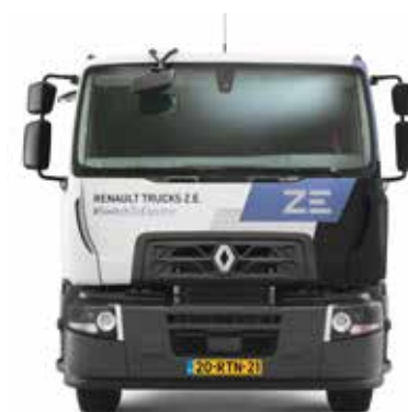
RENAULT TRUCKS D WIDE Z.E.