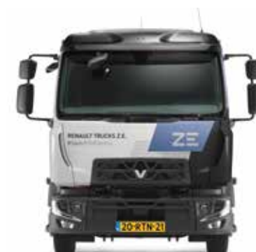
RENAULT TRUCKS D Z.E.