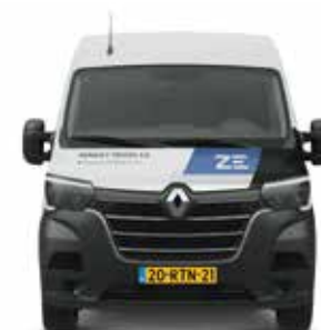
RENAULT TRUCKS MASTER Z.E.